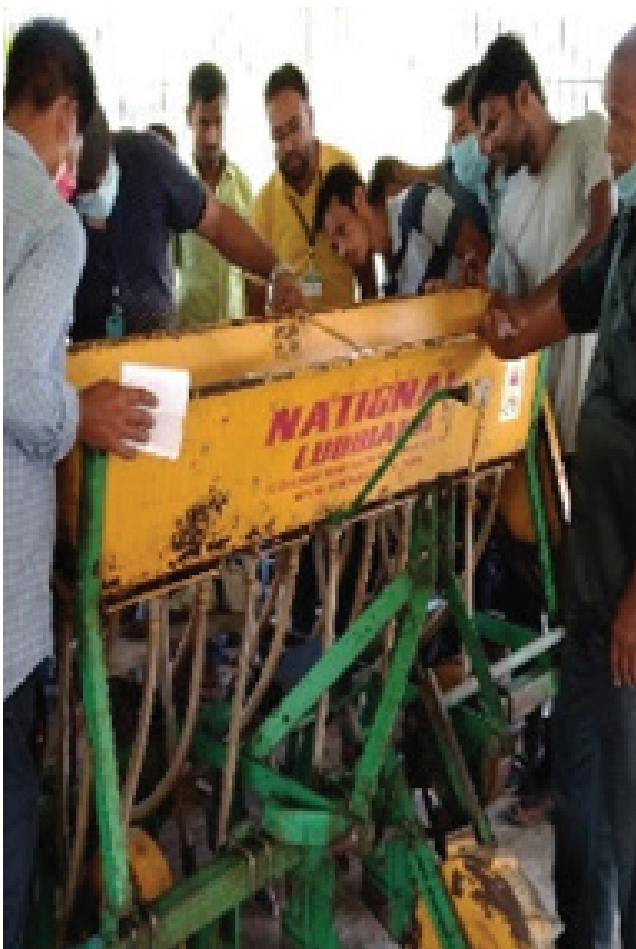
Seed cum fertilizer drill and sprayer