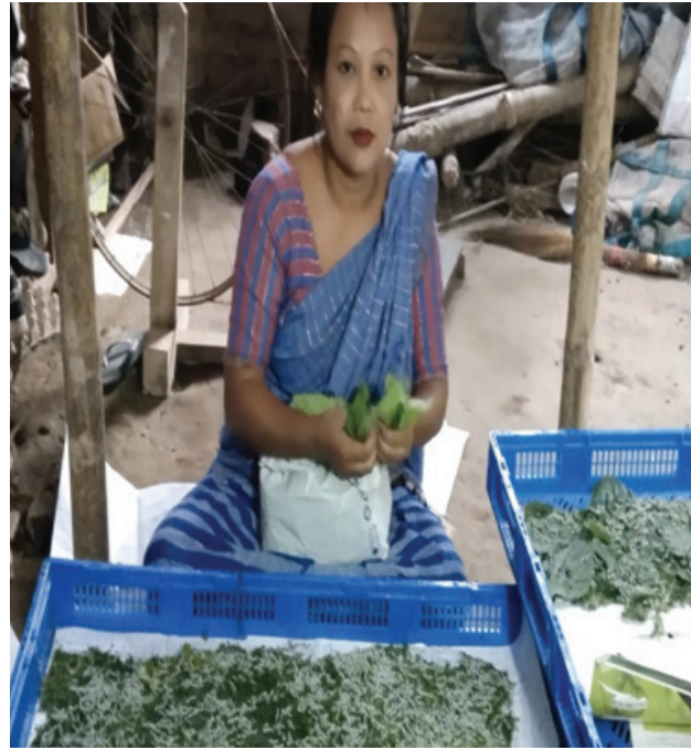
Feeding early stage eri silkworm