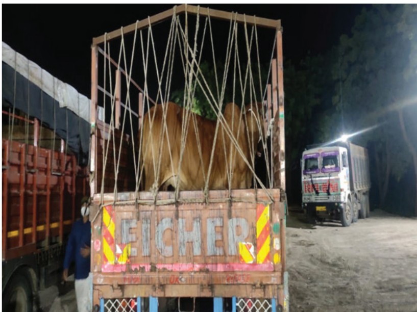
Loading in trucks from Bhavnagar to Ahmedabad railway station

The milk production data from 2007 to 2019 shows a gradual increase in milk availability from 824 to 945 million litres, still, the per capita milk availability in Assam is very low compared to other States. Going by the ICMR recommendation of 2588.00 million litres (2019-20), there is a shortfall in production of 1618.00 million litres with annual market availability of 1370.00 million litres.