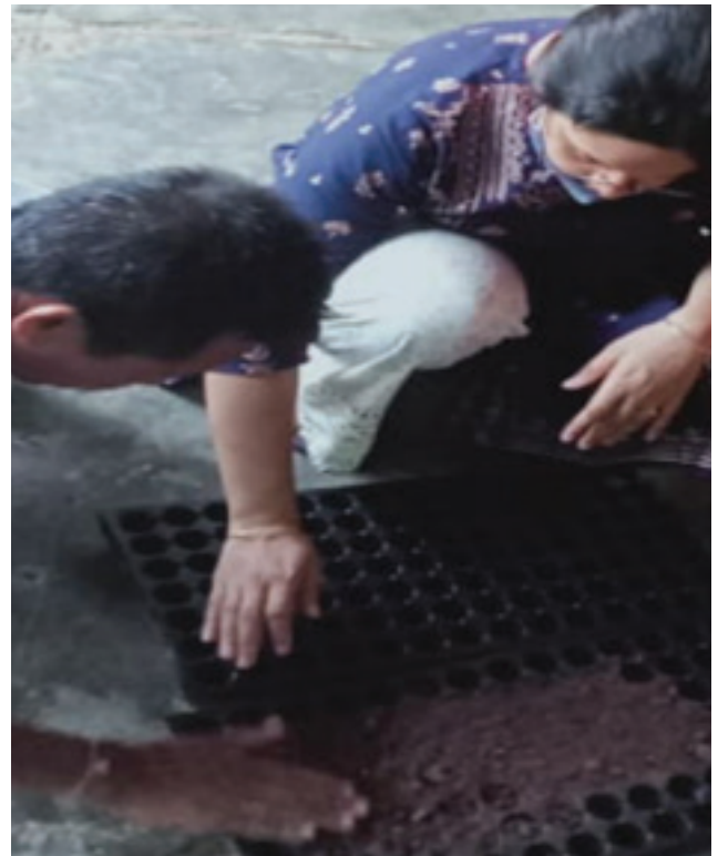
Technical Training on Cauliflower at Sonapur, Kamrup District by WorldVeg team