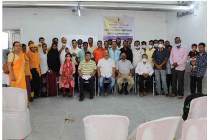
Participants during the Orientation Programme

assessment of DCSs was also organised for the members of DCSs of peri-urban areas of Kamrup district on 21st August 2021 at TMSS, Khanapara, under APART Dairy Development Department. A total of 30 participants from 18 different DCSs attended the programme.