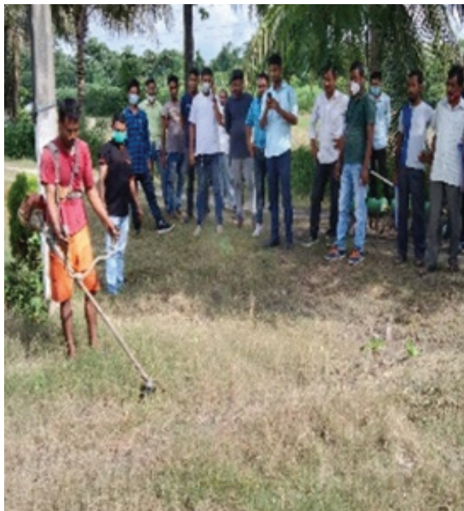
Demonstration of the use of power weeder

Mechanization plays a pivotal role in the modern agricultural scenario of the country to earn maximum profit in the stipulated time and resources availability. It is high time to adopt new technologies over conventional methods of cultivation to maximise productivity. The concept of Farmer Producer Company (FPC) is a prime focus in Assam under Assam Agribusiness & Rural Transformation Project (APART). The FPCs are strengthened through the support of Custom Hiring Centres (CHCs) for farm mechanization at various locations of the state. CHC is a place where all the farm equipment is made available on affordable rental mainly to the small and marginal farmers. Farmers can hire the machineries as and when required from the CHCs. For sustainability of these CHCs, ARIAS Society has started seven training facility centres at 7 KVKs for providing hands-on training in collaboration with AAU and IRRI on repair, maintenance, and operation of different farm machineries to the FPCs. The hands-on training will be given by experts from