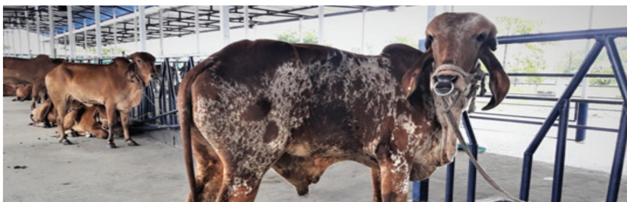
Gir cows inside the Cattle shed