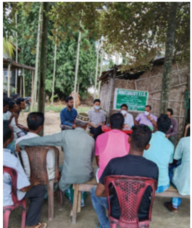
Interaction of WorldVeg team Centre team with FIGs, Vegetable farmers and traders