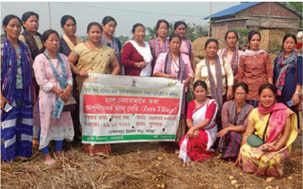
Women farmers of Arunachal Pradesh visiting the demo plot

Smt Bondana Bora has become a source of great inspiration for all the women of her village.