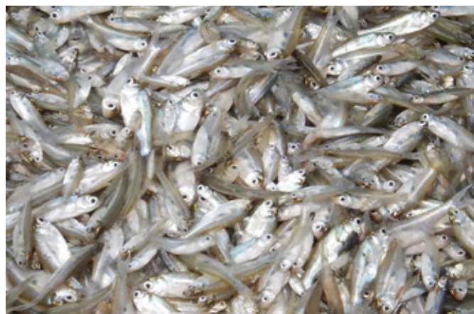
Amblypharyngodon mola : Moa fish

stunting due to better overall health and growth meaning that fish is a highly nutritious food for pregnant and lactating women and children. Furthermore, because fish have a lower environmental footprint compared to many other animal-source foods, experts also recommend fish as a sustainable food that is healthy for both the planet and human health.