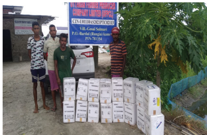
Live fish seed made available for fish farmers through FPCs