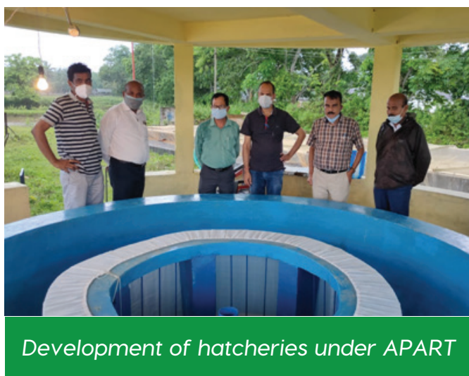
Development of hatcheries under APART