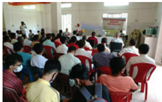
Awareness programme cum assessment of DCSs