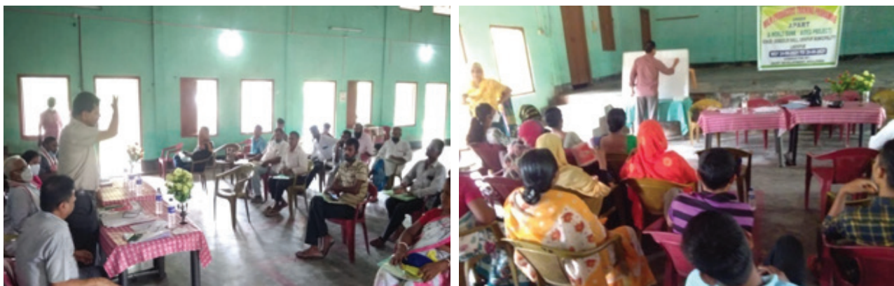
Training to Milk Producers

To improve the milk quality and safety in the existing informal milk value chain, a training programme for milk producers, with the technical guidance from ILRI under APART, was conducted by the Dairy Development Department (DDD) at Kokrajhar from 17th to 21st August, 2021 and at Lakhipur, Goalpara from 24th to 28th August, 2021. A total of 36 participants from Kokrajhar and 30 participants from Goalpara districts, attended the 5 days training programme. OPIU-DDD will encourage adoption of the new improved practices discussed during the training and also do a continuous follow up of the same.