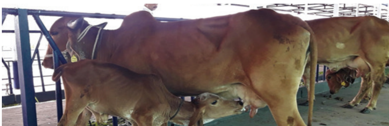
Healthy mother and calf after the long travel (Gujarat to Assam)

Above and all, the main challenge was the distance from Gujarat to Assam (3222km). The animals had to travel 5 hours on road (180 km) in the trucks from Bhavnagar to Ahmedabad Railway Station then 72 hours Journey by train and again another 6 hours journey from Guwahati Railway station to Kanyaka Farm. Accordingly, all arrangements including green grasses, straws, and concentrate feeds were loaded in wagons along with water-filled drums and feeding/watering troughs. To make the environment/situation identical, three farmers from Gujarat were requested to accompany the animals in train and thereafter at least one week time stay in the introduced farms. The same was carried out as planned. Another four persons viz. two veterinary field assistants (Bashiruddin Ahmed and Ratul Das) and two supporting staff (Chiranjib Das, and Dilip Ch. Das) were also engaged to come along with the animals to look after the animals during the transit period. The AHVD staff reached Ahmedabad well in advance before loading the animals in the wagon.